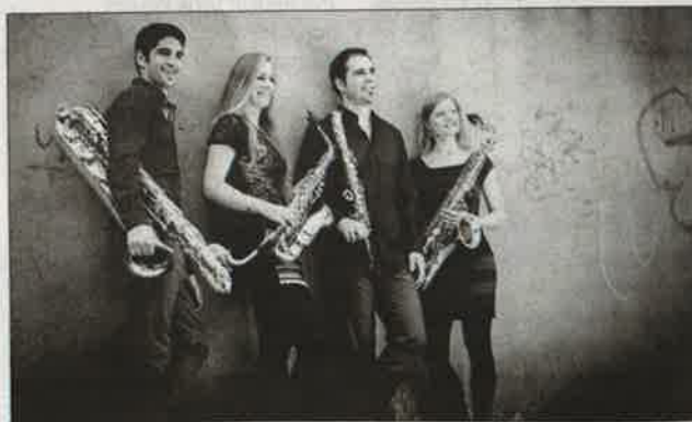
Musikforeningen har koncert 22. februar med saxofonkvartet.

Felix Mendelsohn, György Ligeti og Phillip Glass.